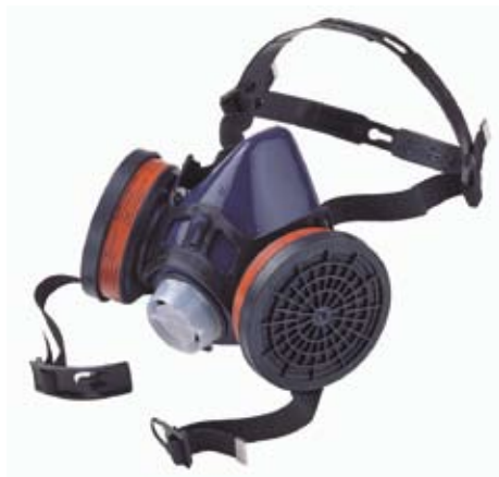
■ Art. 1001575 Art. 1001576 Silikona pusmaska Premier Aizsardzībai no putekļiem un gāzēm. Komplektējama ar Sperian filtriem.