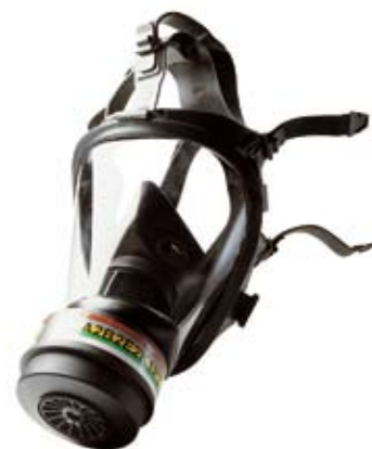
■ Art. 1715001 (S) Art. 1715011 (M) Art. 1715021 (L) Pilna sejas maska Optifit Aizsargmaska paredzēta aizsardzībai no gāzēm un putekļiem, komplektē- jama ar filtriem ar vītņi pēc EN 148-1 standarta.