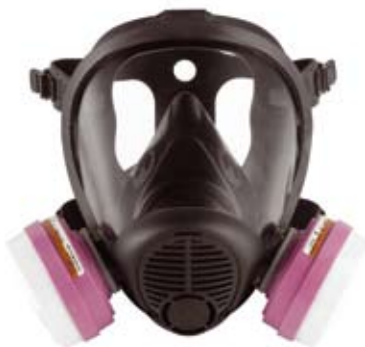
■ Art. 1715231 (S) Art. 1715241 (M) Art. 1715251 (L) Pilna sejas maska Optifit Twin Aizsargmaska paredzēta aizsardzībai no gāzēm un putekļiem, komplektē- jama ar Sperian filtriem.