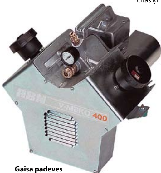
Gaisa padeves kompresors

Izmanto gaisa temperatūras palielināšanai vai samazināšanai no gaisa kompresora. Darbojas bez elektrības, nesatur freonu un citas ķīmiskās vielas